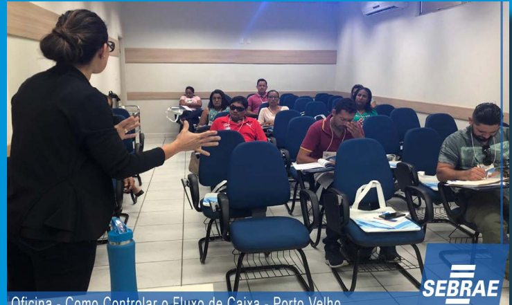
Oficina - Como Controlar o Fluxo de Caixa - Porto Velho