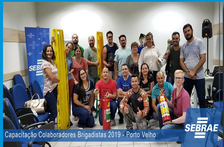
Capacitação Colaboradores Brigadistas 2019 - Porto Velho