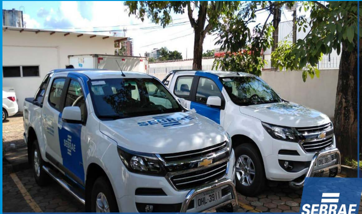
Aquisição novos veículos - Porto Velho