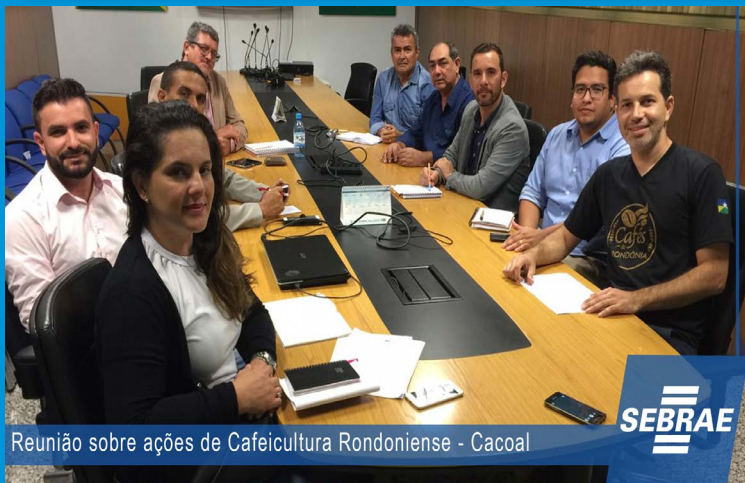
Reunião sobre ações de Cafeicultura Rondoniense - Cacoal