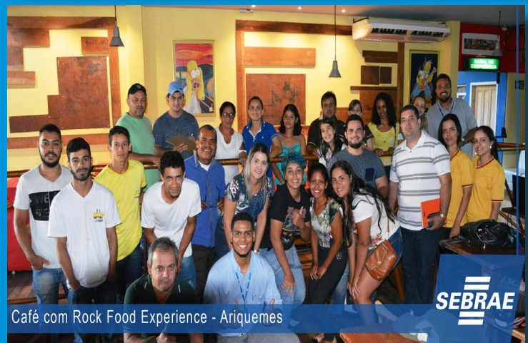
Café com Rock Food Experience - Ariquemes