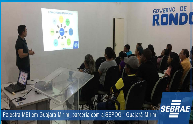
Palestra MEI em Guajará Mirim, parceria com a SEPOG - Guajará-Mirim