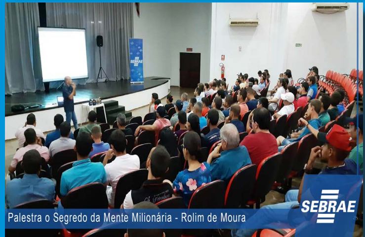
Palestra o Segredo da Mente Milionária - Rolim de Moura